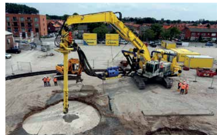
grote foto INLINE PAVE

Boskalis Nederland heeft alle benodigde certificaten in huis. Recent is daar de OCE aan toegevoegd. Onze professionals zijn nu bevoegd om zelf eventuele explosieven op te sporen op onze projecten.